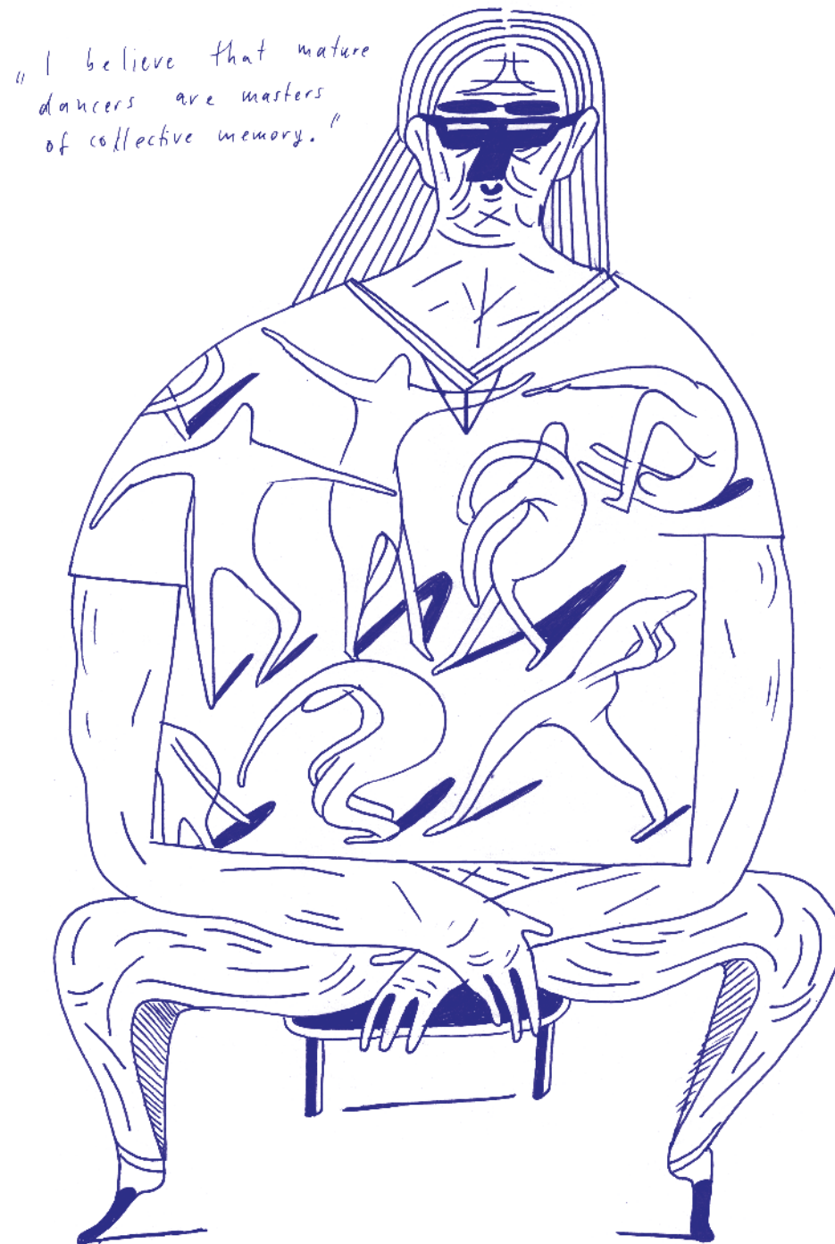
Illustration: Johanna Benz

Music is such a powerful monster; it can drastically effect what we see. My starting point is often rhythm. What kind of rhythm is the dance? Can I counterpoint it? Can I produce the right kind of tension? Does it benefit from another layer or does the music flatten everything? Is it ultimately better, tougher, in silence?